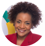
Michaëlle Jean Secrétaire générale de la Francophonie

Le Grand Tour : Voyage en Francophonie, c'est également un grand rendez-vous avec l'histoire d'une humanité qui se dit en français.