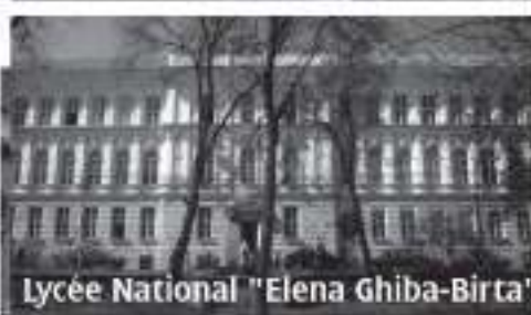
Lycée National "Elena Ghiba-Birta"